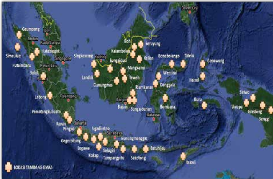
Gambar 2. Sebaran Penambang Emas Skala Kecil (PESK) di Indonesia

Proses kerja yang tidak memperhatikan standar pengelolaan merkuri sebagai bahan beracun dan berbahaya (B3) dari mulai bahan baku hingga pembuangan limbah akan menimbulkan pencemaran lingkungan dan berisiko pada kesehatan pekerja, masyarakat sekitar hingga masyarakat luas yang lokasinya jauh dari lingkungan kerja. Beberapa kajian terkait pengukuran kadar merkuri di lingkungan telah menunjukkan pencemaran lingkungan di beberapa wilayah Indonesia.